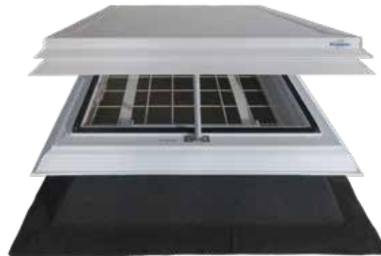
Dunkelklappe LK DKL neo plus mit Ab- und Durchsturzsicherung RSM und Linearantrieb zur natürlichen Be- und Entlüftung