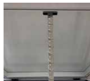
Dunkelklappe LK DKL neo plus mit Kettenantrieb - Innenansicht